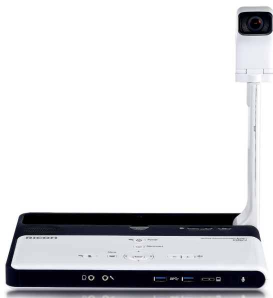
O P3500M - equipamento portátil de videoconferência da Ricoh.